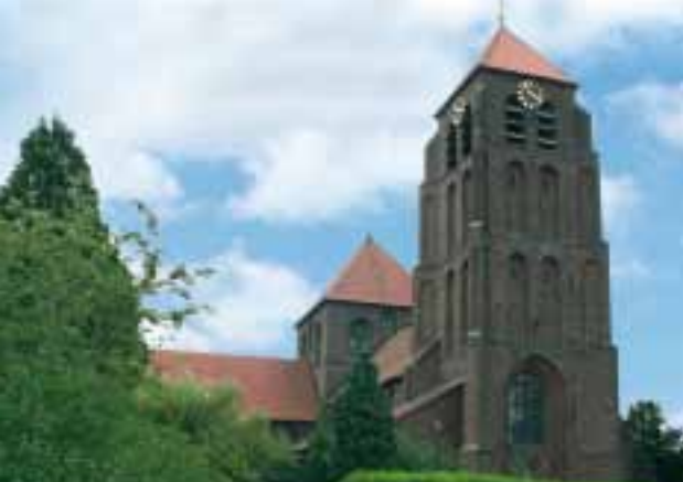
OLV Tenhemelopneming - Doetinchem