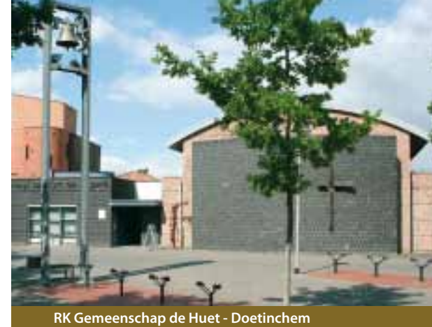
RK Gemeenschap de Huet - Doetinchem