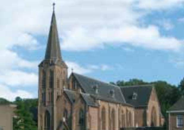
H. Georgius - Terborg