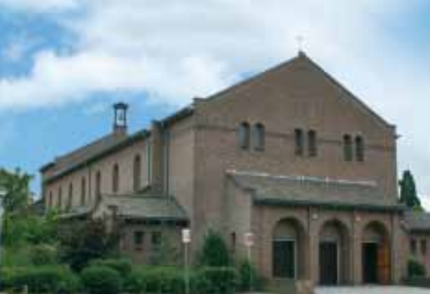
H. Augustinuskerk - Gaanderen